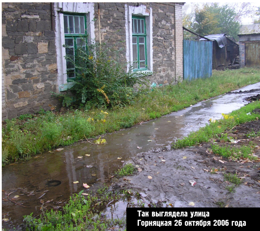
Так выглядела улица Горняцкая 26 октября 2006 года

В случае отказа водоснабжающей организации вопрос следует решать в судебном порядке.